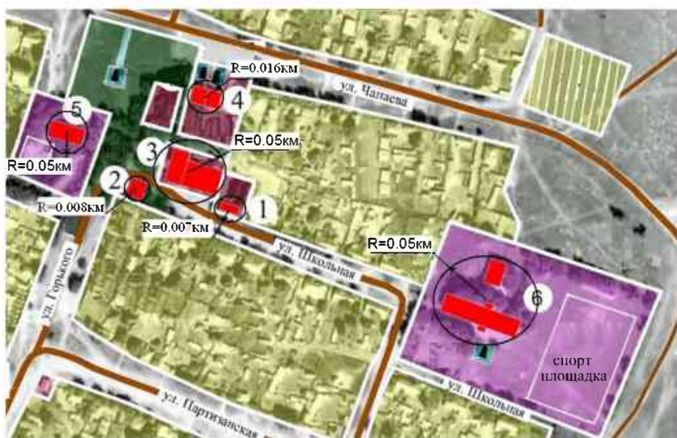
Рисунок 2.1 Радиус эффективного теплоснабжения источников тепловой энергии а.Куликовы-Копани.

Схема радиуса эффективного теплоснабжения источников тепловой энергии а.Куликовы-Копани приведена на рисунке 2.1.