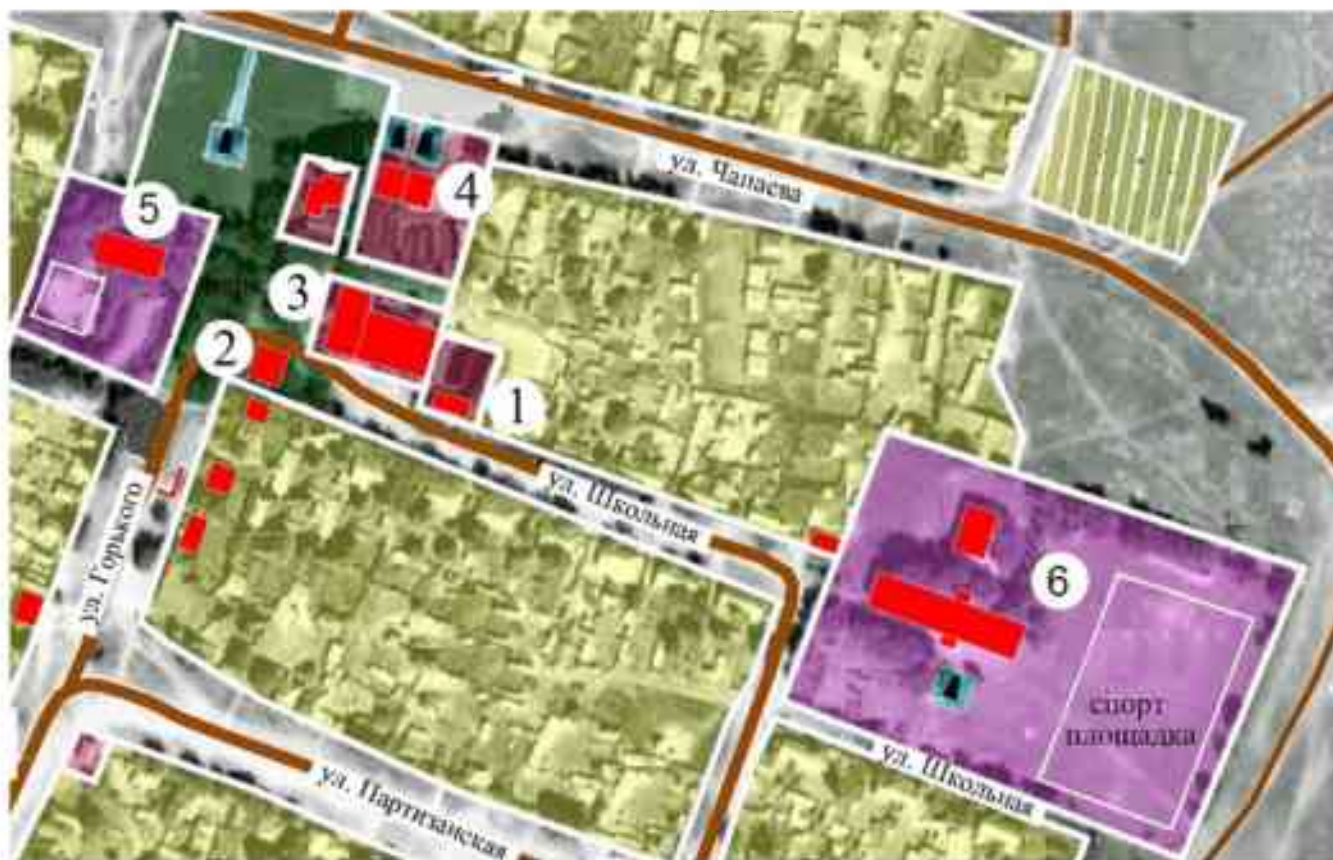
Рисунок 1.1 Источники тепловой энергии:

Схематическое расположение источников и потребителей тепловой энергии представлено на рисунке 1.1